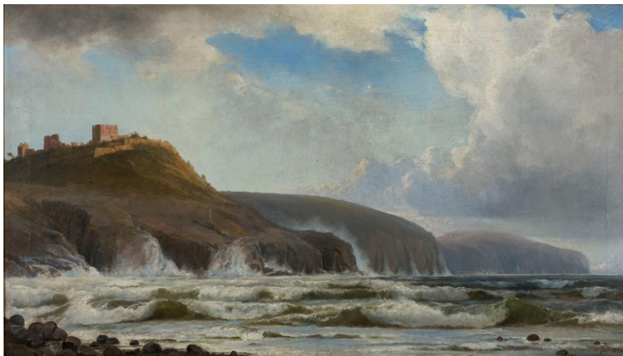
Kysten ved Hammershus. Maleri af Holger Drachmann, 1870. Bornholms Kunstmuseum.

Vragets position er hemmeligholdt, men det siges at ligge på 52 meters dybde. Dykkerne har ved eftersyn af vraget observeret, at skibets ror mangler. Det er simpelt hen væk, og man mener i dag, at "Jarl" den skæbnsvangre nat måske har tabt roret. Uden styring er det blevet ramt af en forkert sø, drejet rundt, og er gået ned uden varsel – og med mand og mus.